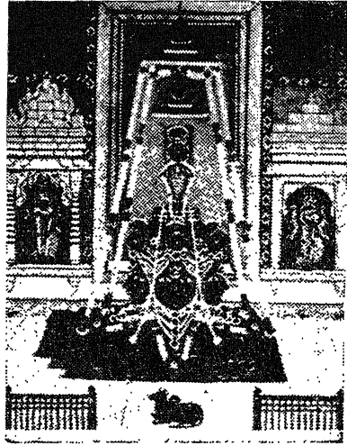
( एकलिंग जी की प्रतिमा )